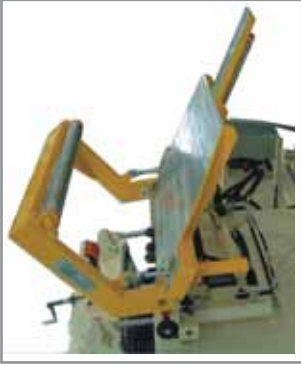
Gruppo introduttore Introduction group