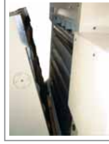
Apertura idraulica della testa per la pulizia dei rulli, per l'introduzione del materiale e per lo sgancio piloti ad ogni colpo della pressa Hydraulic head's opening for rolls cleaning, to facilitate the introduction of the material and for complete opening of the upper part so that the strip can be released at each press stroke