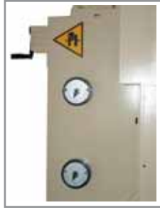
Indicatori della snervatura e della raddrizzatura Numerical gauge to adjust yield- ing and straightening rolls