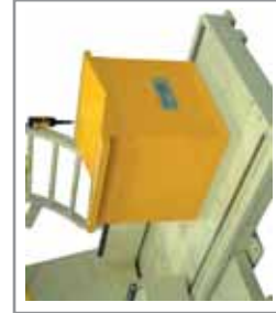
Culla di carico Loading elevator