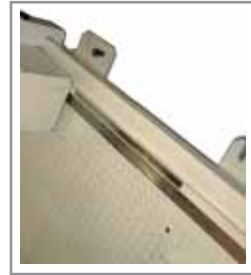
Traslazione Transversal movement