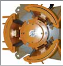
Espansione a cunei Wedge expansion