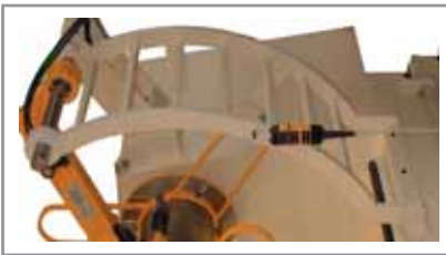
Contenimento Posteriore Rear holding piece