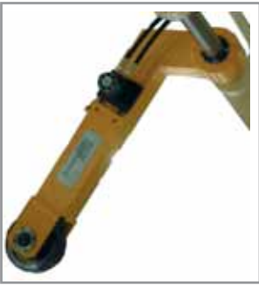
Braccio pressore Pressure arm