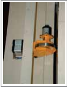
Ruota metrica per controllo posizionamento materiale Measuring wheel to control the position of the material